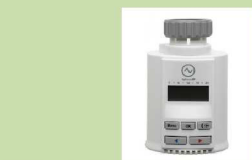
VALVULA DOMOTICA RADIADOR MODELO W900