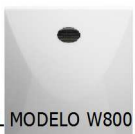
SEÑAL MODELO W800